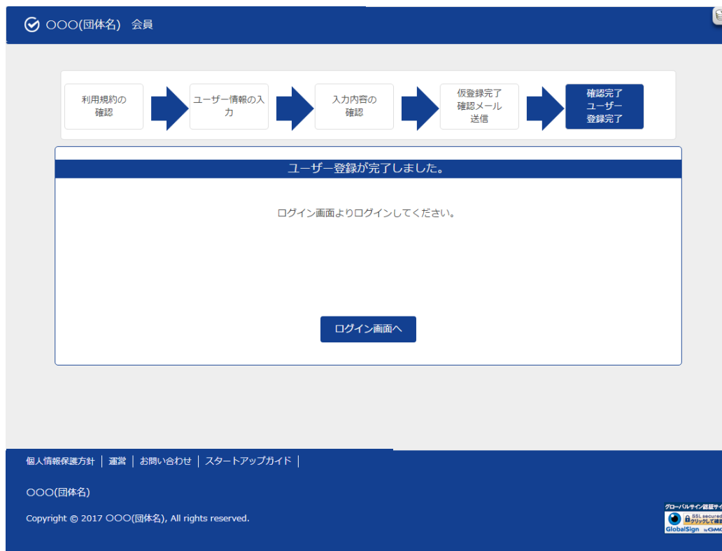
ユーザー登録完了画面

⑪URLをクリックするとユーザー登録完了画面が表示され、ユーザー登録が完了します。