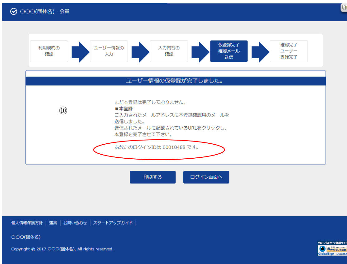
ユーザー仮登録完了画面